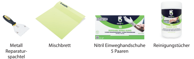
Metall Reparatur- spachtel